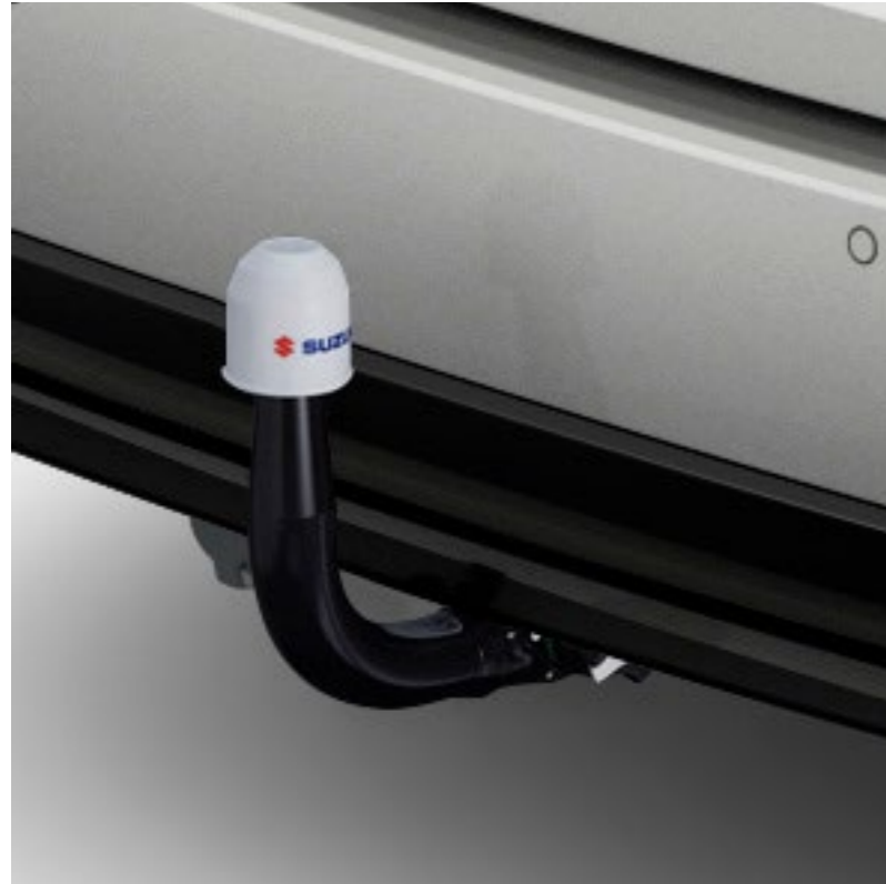
Art.-Nr. 99002-54Z00-042 Für Anhänger und Trägersysteme. E-Satz bitte separat bestellen.