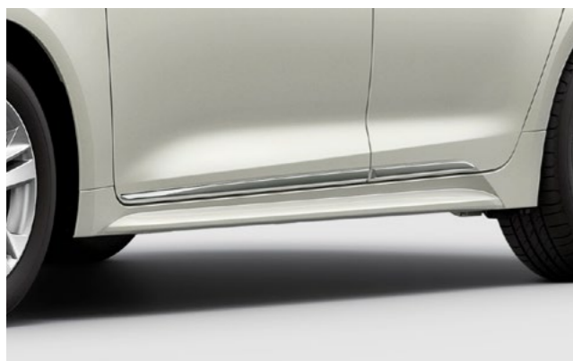
Art.-Nr. 99002-54Z00-010 Chrome, 4-teiliges Set.