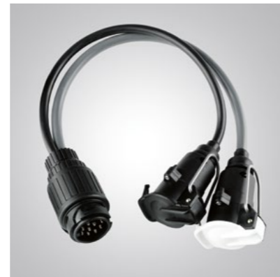
Art.-Nr. 99002-54Z00-026 Zum Verbinden von 12N/12S-Stecker mit 13-poliger Buchse.