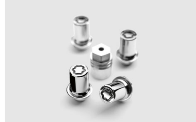
Art.-Nr. 99002-54Z00-029 4-teiliges Set, inkl. Adapter zur Befestigung.