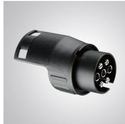
Art.-Nr. 99002-54Z00-028 Zum Verbinden von 13-poligem Stecker mit 7-poliger Buchse.