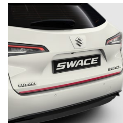
Art.-Nr. 99002-54Z00-009 Rot.