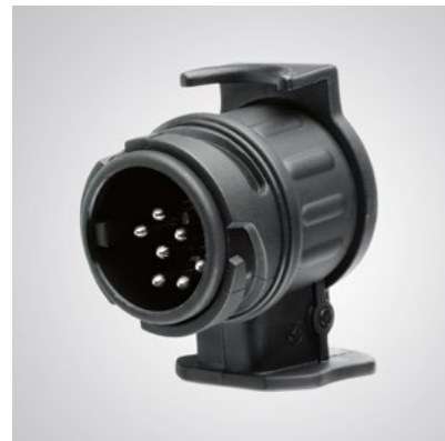
Art.-Nr. 99002-54Z00-027 Zum Verbinden von 7-poligem Stecker mit 13-poliger Buchse.