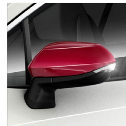
Art.-Nr. 99002-54Z00-007 Rot.