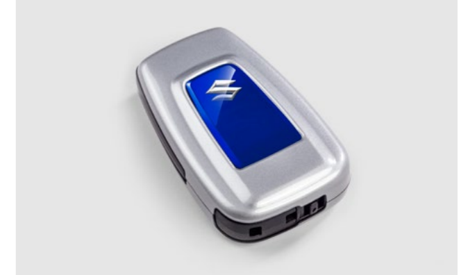
Art.-Nr. 99002-54Z00-016 Schützt den Schlüssel vor Kratzern.