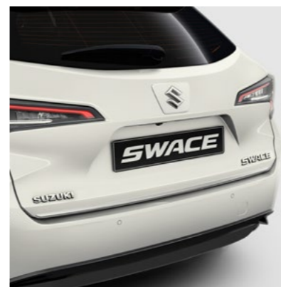
Art.-Nr. 99002-54Z00-008 Chrome.