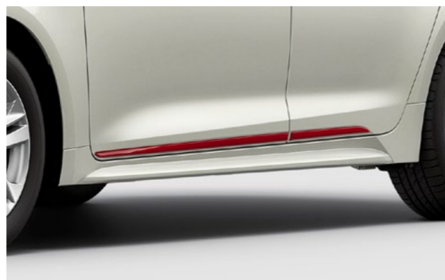
Art.-Nr. 99002-54Z00-011 Rot, 4-teiliges Set.